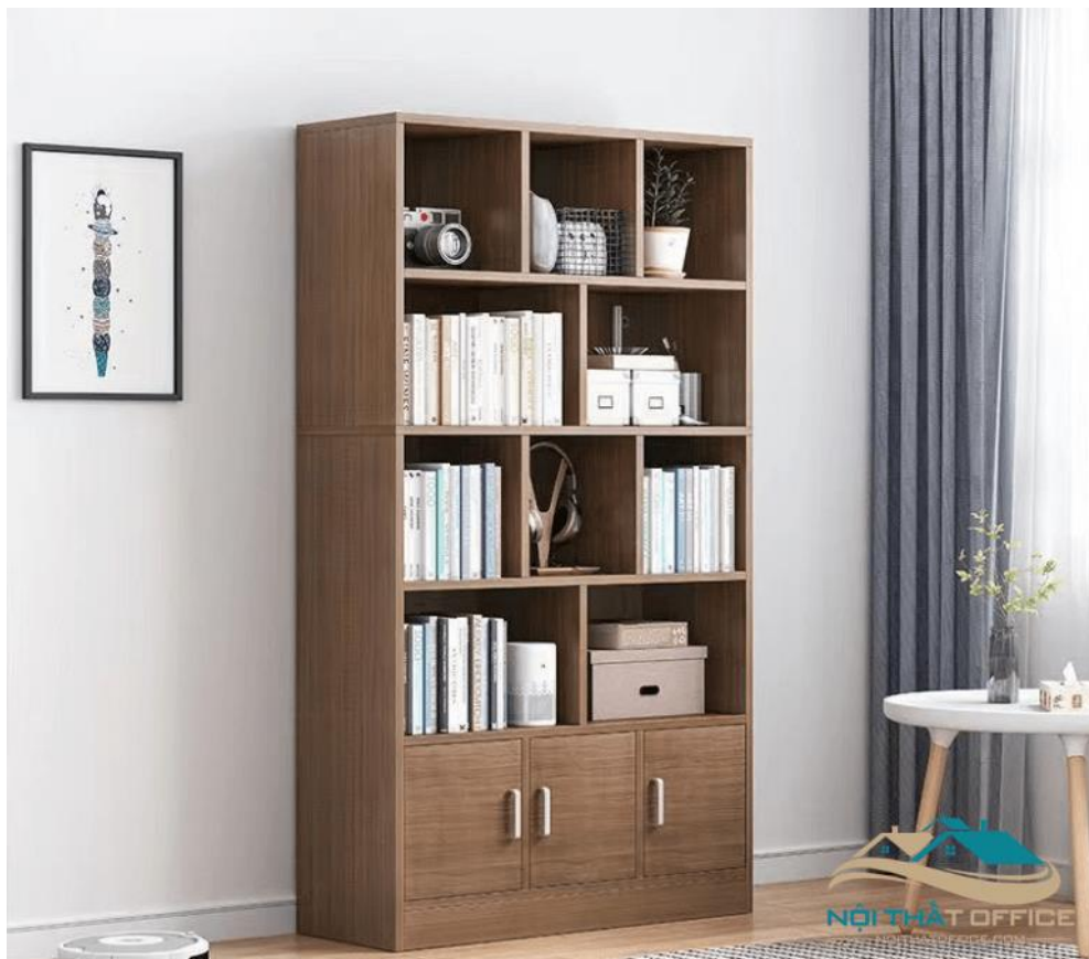
Tủ Kệ Đựng Hồ Sơ Cho Văn Phòng TKS-11

Nếu như tủ liền phía trên bàn không đủ không gian để chứa sách và tài liệu, Nội Thất Office gợi ý mẫu tủ giá rẻ với thiết kế hiện đại, tăng thêm không gian chứa đồ của bạn.