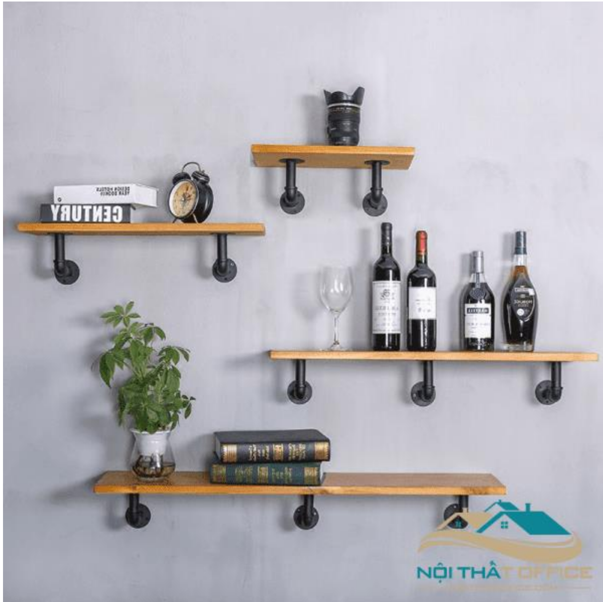
Kệ Trang Trí Cho Phòng Khách, Quán Nước KTT-04

Các sản phẩm trang trí như tranh ảnh, cây xanh hoặc những món đồ trang trí nội thất phòng làm việc khác tại nhà không chỉ giúp bạn tạo một không gian làm việc thoải mái, năng động mà còn giúp bạn nâng cao năng suất và tập trung trong công việc.