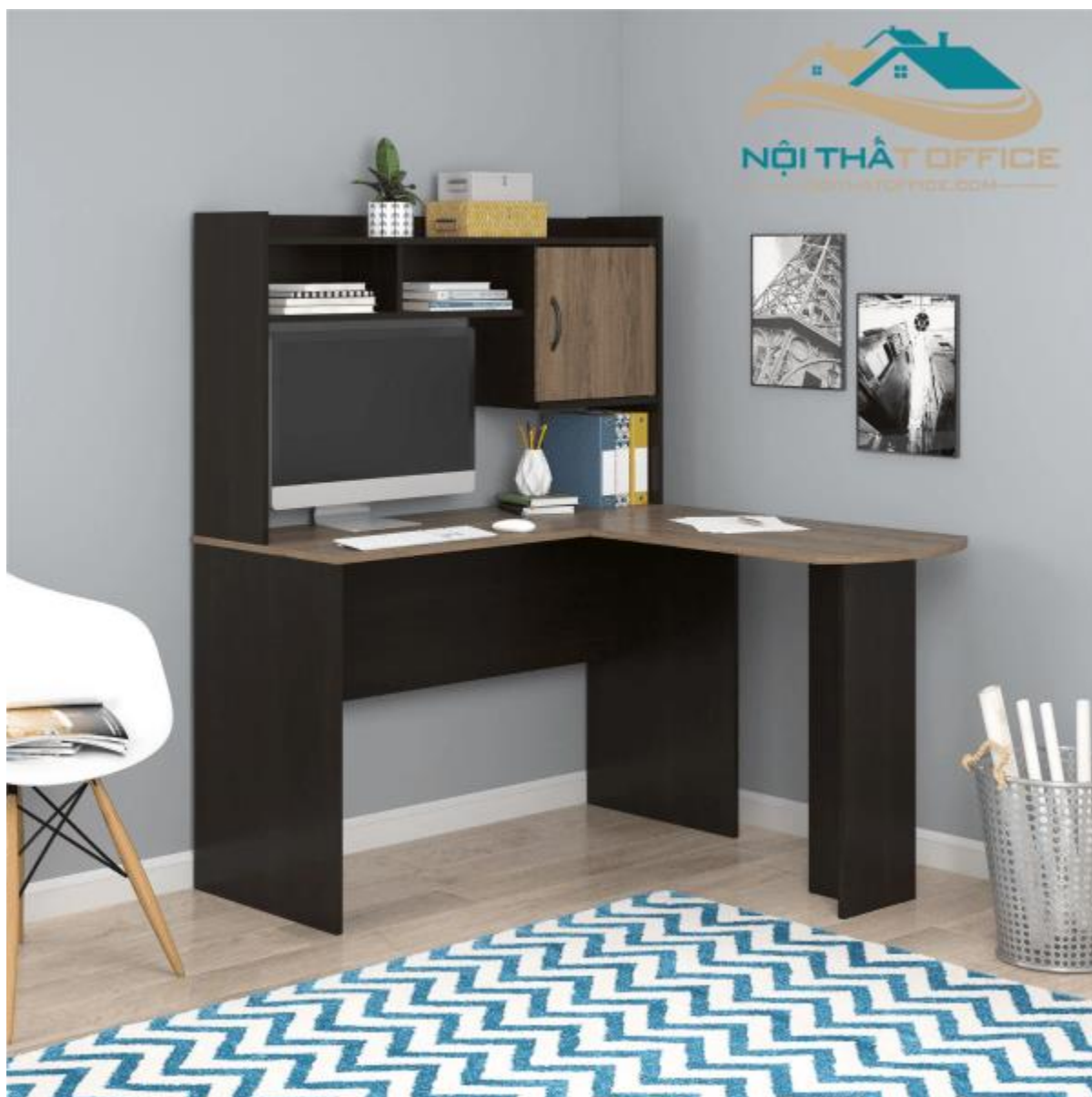
Bàn Làm Việc Chữ L Liên Kệ BLV-53

Bàn làm việc chữ L liên kệ có kích thước 125cm (mặt bàn chính) x 120cm (mặt bàn phụ) x 50cm (chiều rộng mặt bàn) x 153cm (chiều cao), lớn hơn so với các loại bàn làm việc thông thường. Với kiểu dáng L liên kệ, bàn làm việc này có thể được đặt ở nhiều vị trí khác nhau trong phòng làm việc tùy theo mục đích sử dụng, giúp tối ưu hóa không gian và tính linh hoạt trong việc bố trí nội thất văn phòng. Ngoài ra còn giúp tạo ra không gian làm việc rộng rãi hơn cho người sử dụng mà không cần phải mua thêm bàn phụ chiếm diện tích căn phòng.