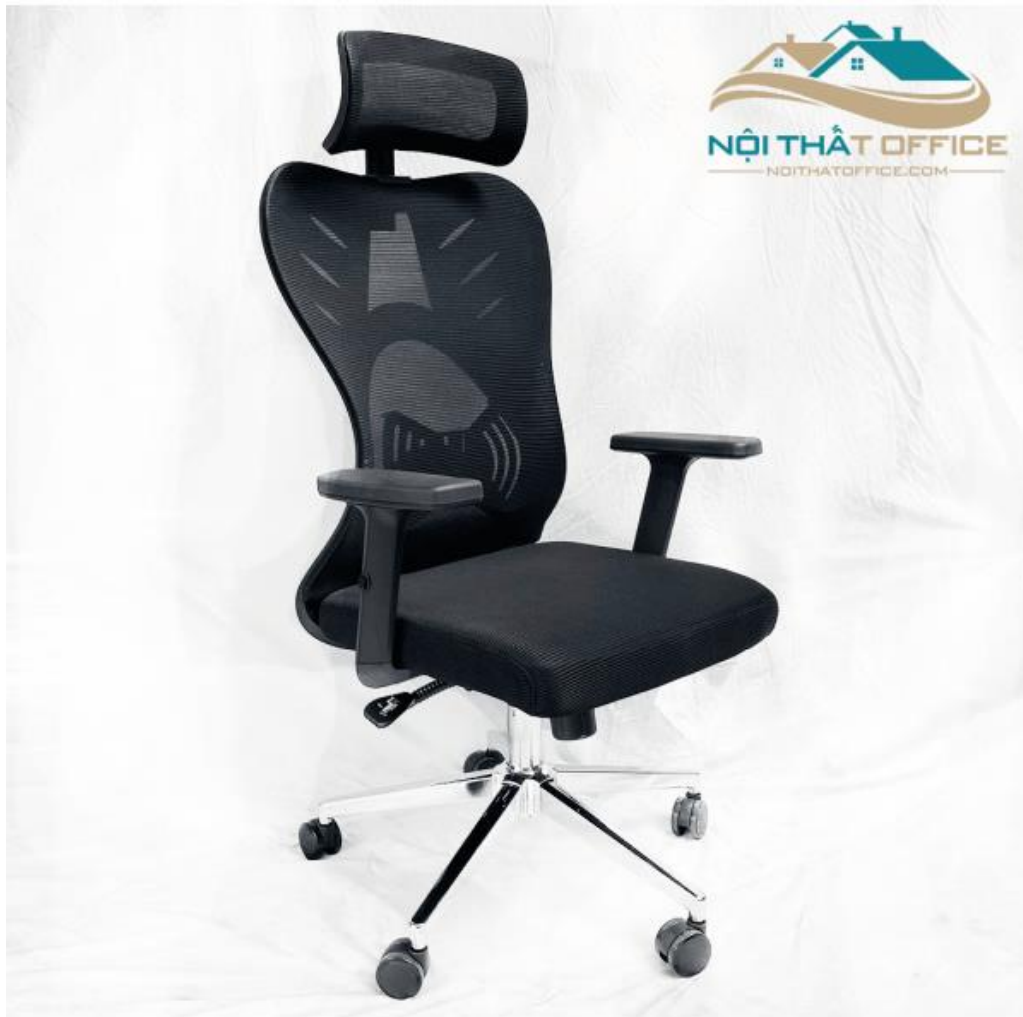
Ghế Làm Việc Tiêu Chuẩn Công Thái Học GLV-10

Ghế văn phòng nên được thiết kế với tính năng tùy chỉnh và hỗ trợ cho lưng và cổ của người sử dụng. Điều này giúp giảm thiểu căng thẳng và đau nhức trong khi làm việc.